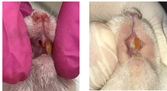
Gambar 2 Perbandingan Penyembuhan Luka Pasca Pencabutan pada Kelompok Perlakuan Rahang Bawah dengan VCO Oral pada Tikus Wistar antara Hari ke-1 dan hari ke-7