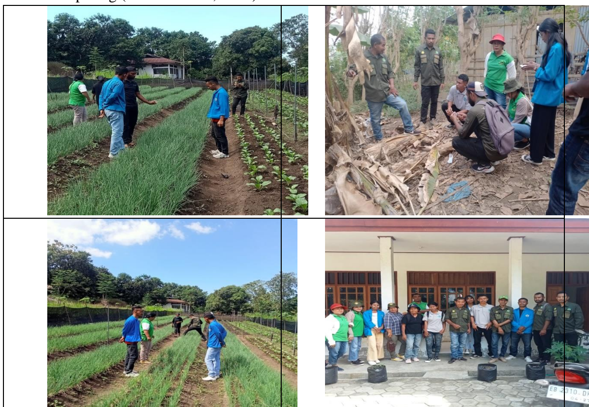
Gambar 11. Kunjungan ke Kantor BPP (Badan Penyuluhan Pertanian)

Hasil survey pendahuluan dilokasi yaitu belum adanya belum dilakukan eradikasi total dan pengendalian hama fusarium, penyakit darah, layu bakteri pada tanaman pisang. Untuk mengatasi masalah tersebut, maka dilakukan pengabdian masyarakat melalui KKN mandiri 2023, dengan eradikasi total dan pengendalian hama fusarium, penyakit darah, layu bakteri pada tanaman pisang (SEMBIRING, 2021).