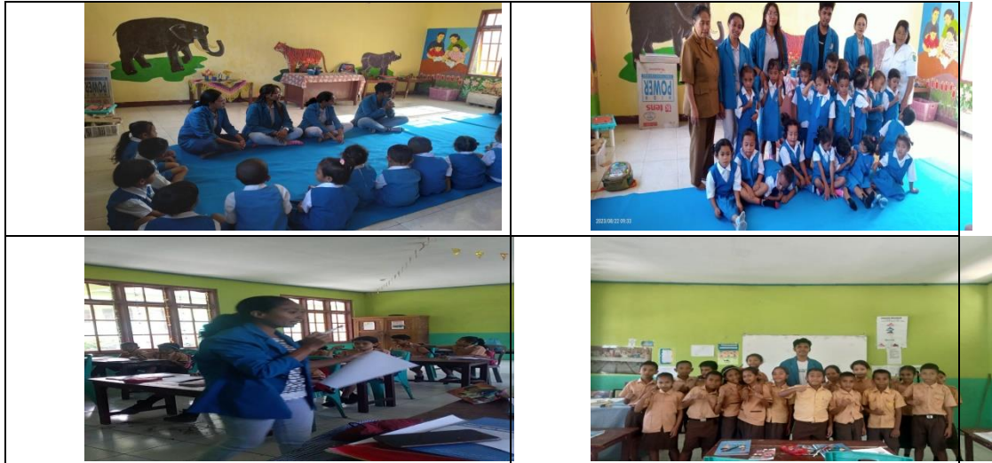
Gambar 6. Pembelajaran dan Pengenalan Kosa Kata Berbahasa Inggris

Kegiatan pengenalan kosa kata dan pembelajaran bahasa Inggris di tingkat TK dan SD merupakan program kerja yang dilakukan oleh mahasiswa prodi sastra Inggris selama 1 hari di tingkat TK dan SD. Hal ini dilakukan agar siswa/i sekolah dasar maupun TK dapat sedikit memahami beberapa kosa kata yang dibungkus dengan penjelasan yang menarik sehingga siswi/i mampu memahami dengan baik.