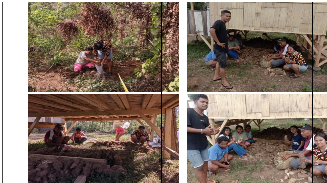
Gambar 7. Panen Ubi Tongkat Bersama Kelompok Tani Dusun Bojawa di Kebun Desa