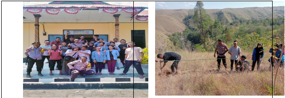
Gambar 9. Penghijauan