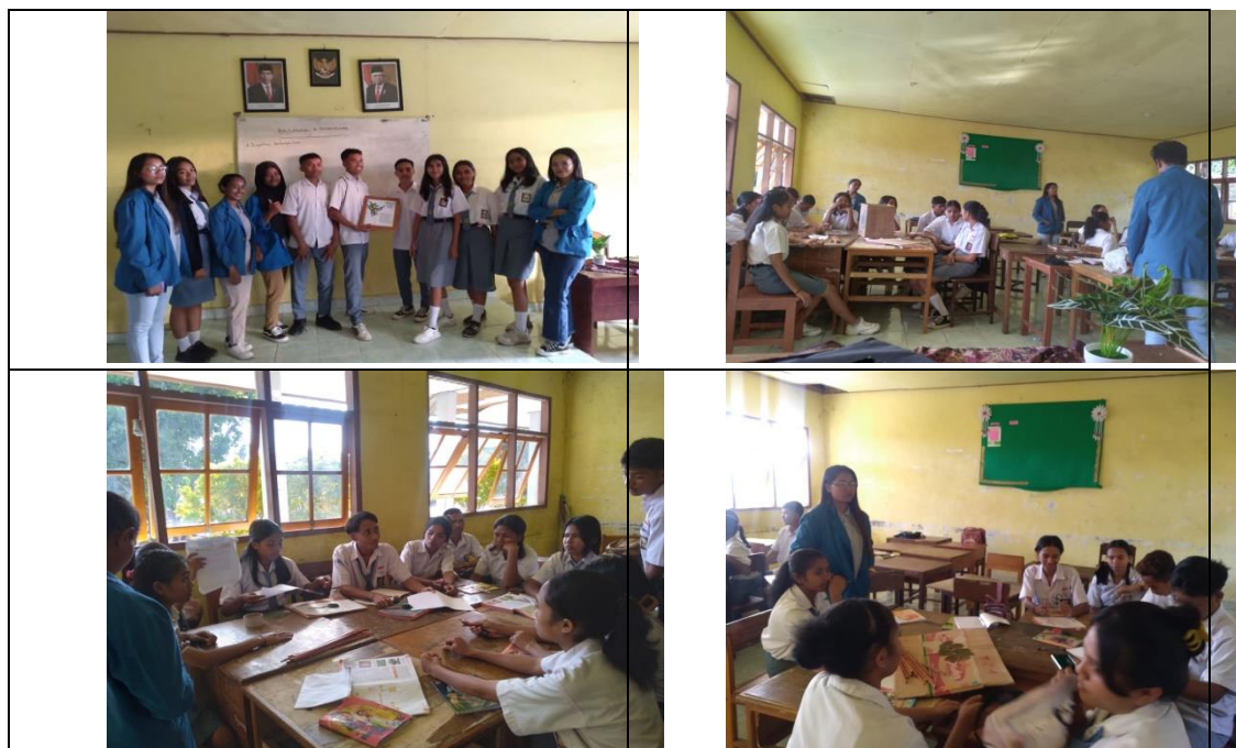
Gambar 8. Sosialisasi Media Pembelajaran Herbarium