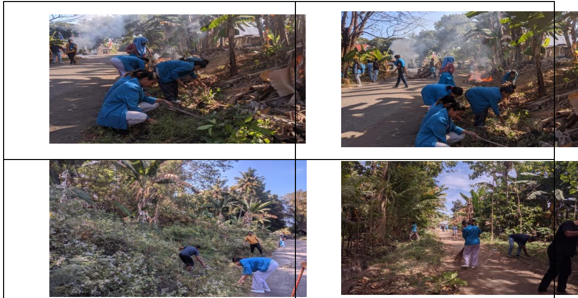
Gambar 2. Kebersihan di area jalanan dusun Ngaluwatu dan dusun suka maju

yaitu, kekurangan peralatan. Hal ini bertujuan untuk menjadikan desa aimere timur bersih dan sejuk.