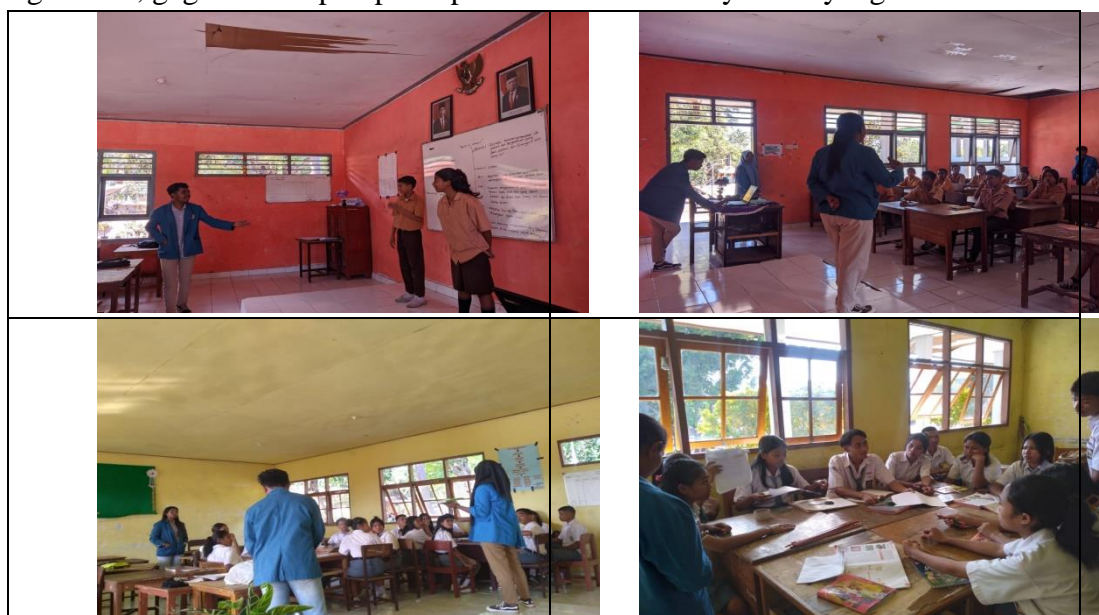
Gambar 5. Sosialisasi Penggunaan Media Sosial (Blog)

Blog merupakan website berupa media online yang berisi konten dalam bentuk artikel, video, dan foto yang dikelola oleh seorang blogger atau beberapa penulis sekaligus. Topik yang ditampilkan pada blog biasanya fokus pada satu bidang tertentu. Misalnya puisi, cerpen, lifestyle, finance, kesehatan, teknologi, kuliner, dan sebagainya. Selain itu, nama domain untuk blog juga disesuaikan dengan bidang yang dibahas (Octafitria, 2016). Kegiatan ini dilakukan oleh mahasiswa KKN prodi PBSI selama 2 hari di sekolah SMA Negeri 1 Aimere. Sasaran kegiatan ini yaitu siswa-siswi kelas X. Kegiatan ini bertujuan untuk sarana branding bagi kaum milenial agar mampu memanfaatkan media sosial terutama blog dalam menuangkan ide, gagasan maupun pendapat dalam sebuah karya tulis yang menarik.