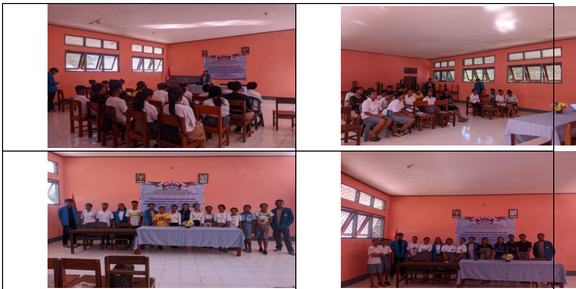
Gambar 4. Sosialisasi UMKM (pembuatan manisan belimbing) dan Design Kemasan