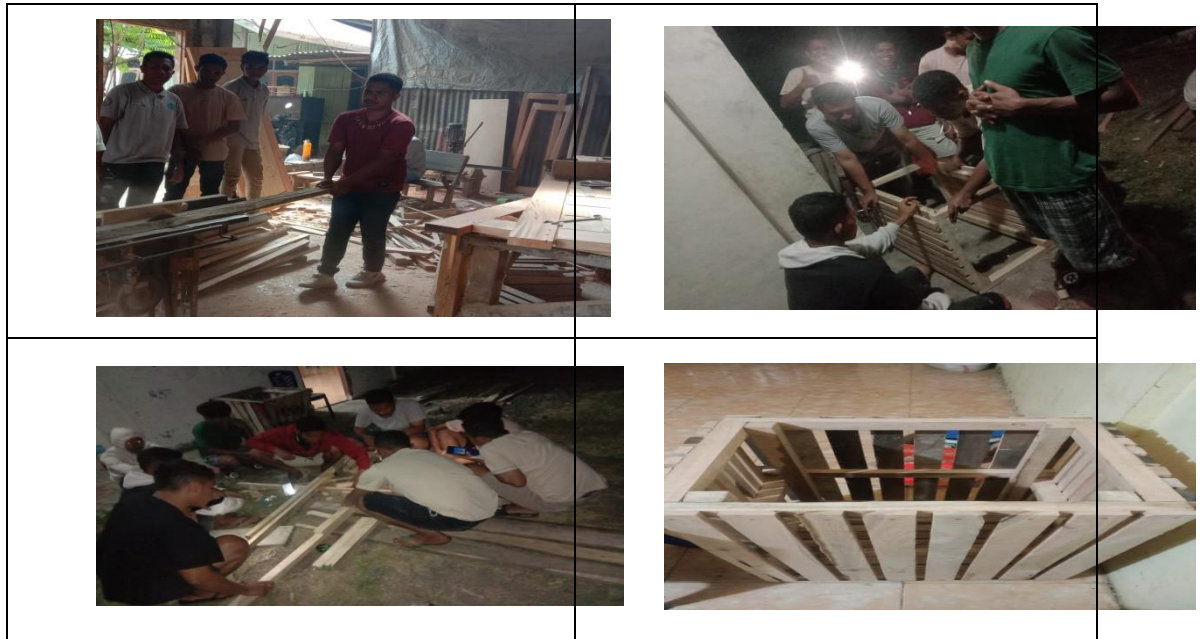
Gambar 3. Pembuatan Bak Sampah Dari Papan Bekas