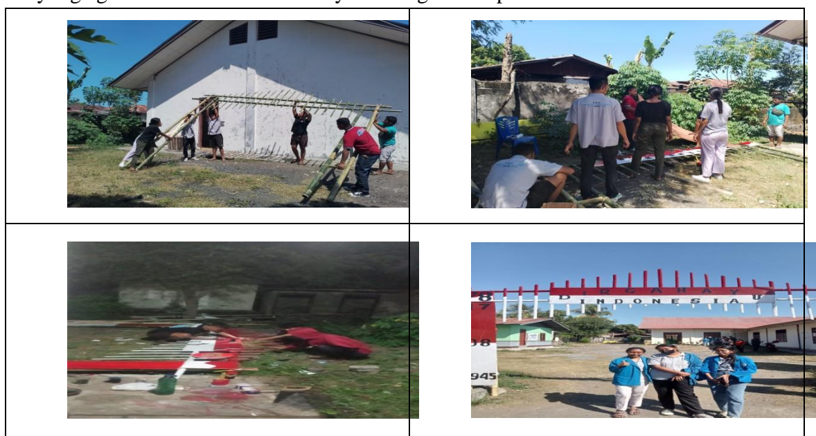
Gambar 1. Pembuatan Gapura Dalam Rangka Memeriahkan Hut RI ke 78