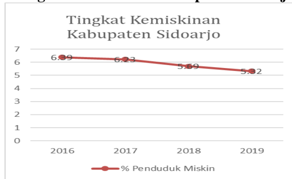
Tabel 2 Tingkat Kemiskinan Kabupaten Sidoarjo

(Badan Pusat Statistik Kabupaten Sidoarjo, 2019)